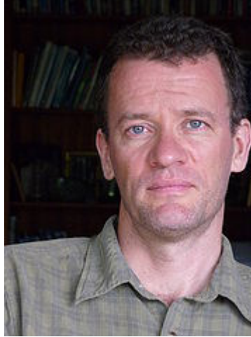
Yann Martel (*1963)