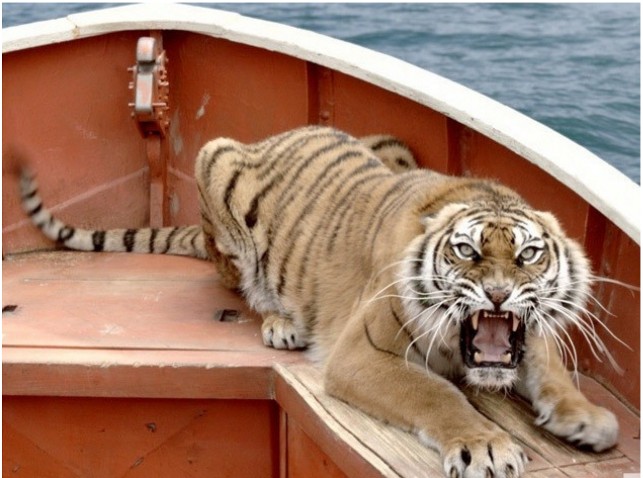
Richardus Parker tigris cum Pio puero naufragus

Cinema secundum argumentum Vitae Pii confectum. A. 2012 secundum hanc fabulam romanicam ab Ang Lee dissignatore scaenarum confectum est cinema.